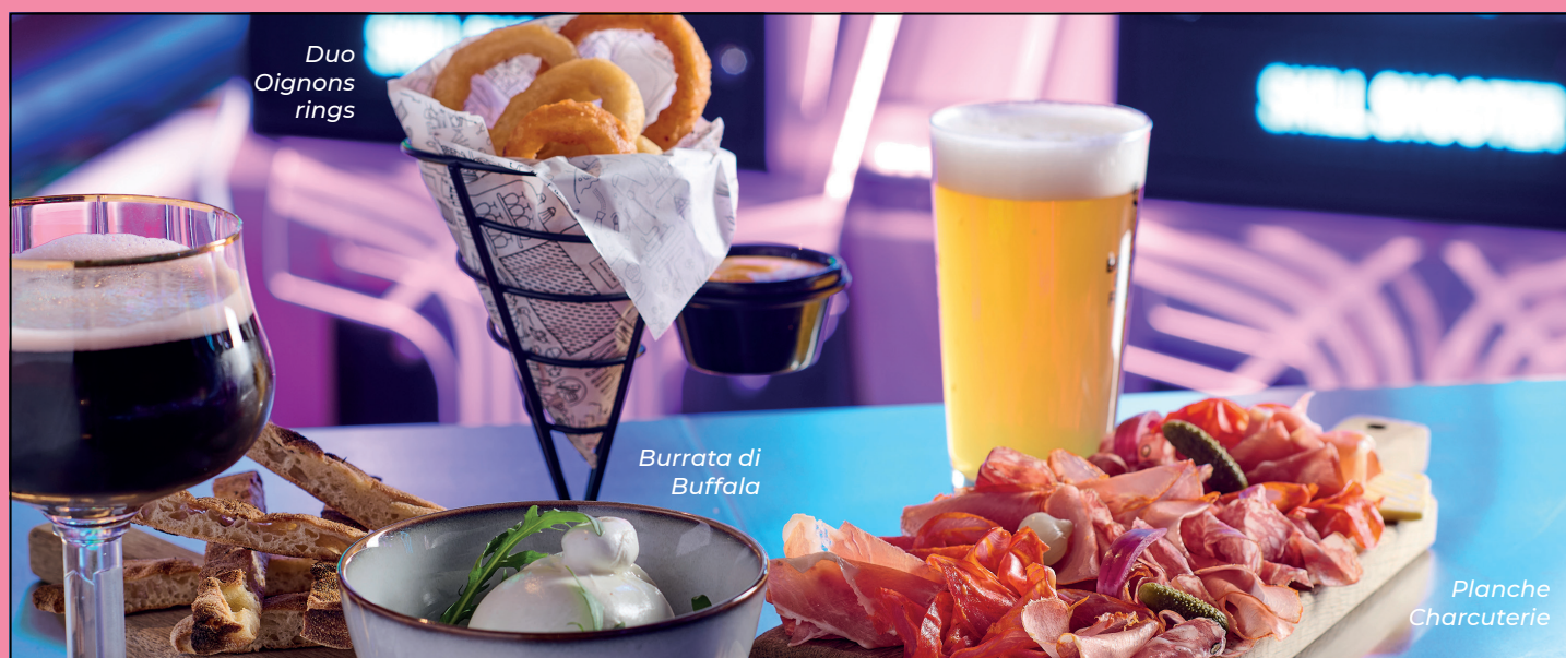
Duo Oignons rings