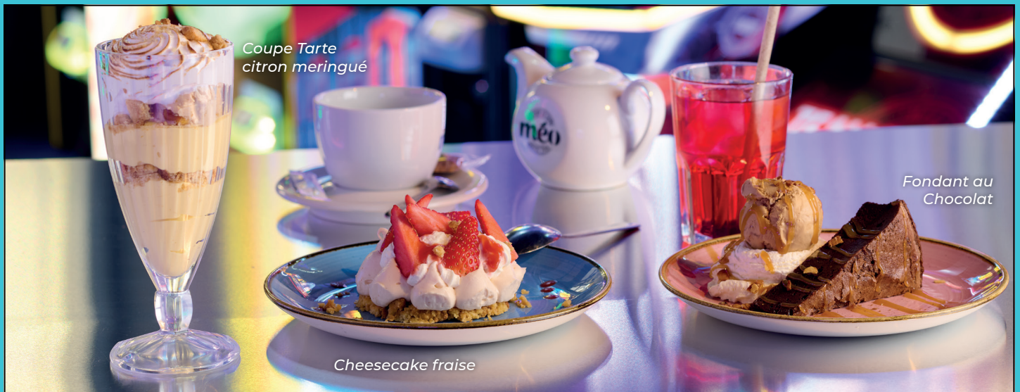
Coupe Tarte citron meringué