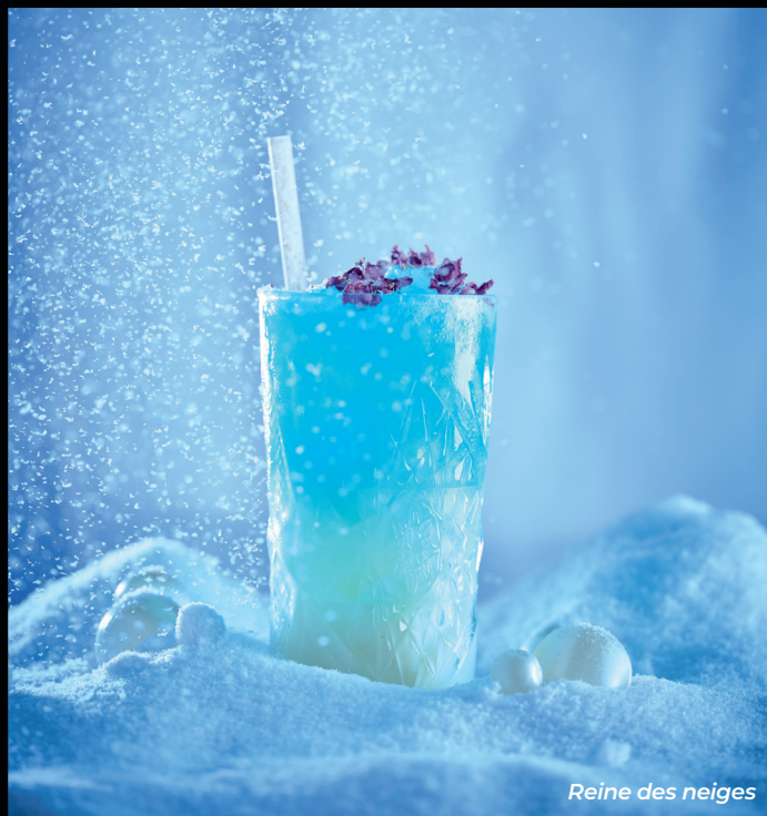
Reine des neiges