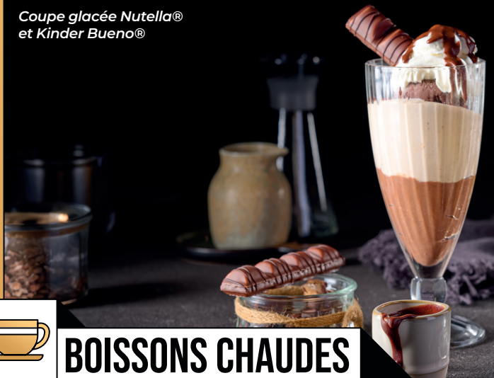
Coupe glacée Nutella® et Kinder Bueno®