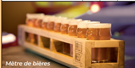
Mètre de bières