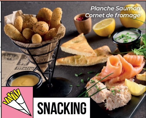
Planche Saumon Cornet de fromage