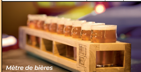
Mètre de bières