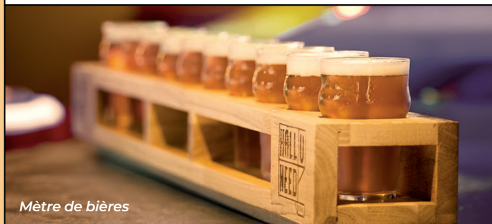
Mètre de bières