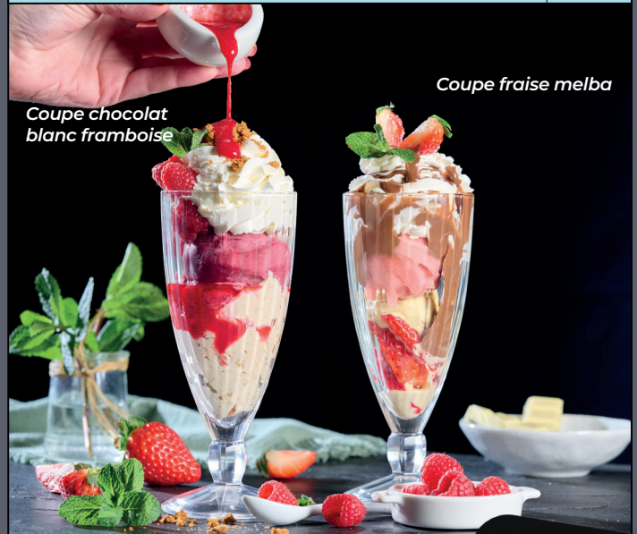
Coupe chocolat blanc framboise