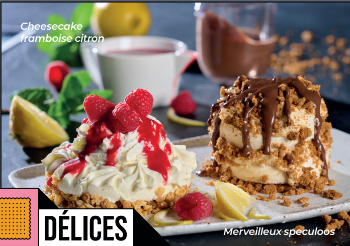
Cheesecake framboise citron