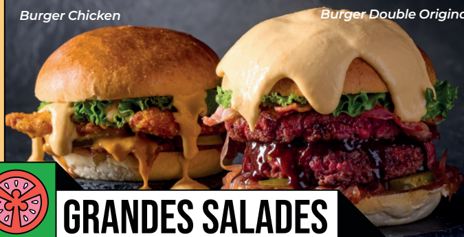
Burger Double Original