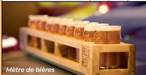
Mètre de bières